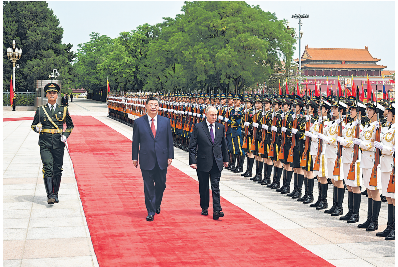
俄羅斯總統普京與中國總理李強於16日在北京舉行會談。圖為雙方在會談後舉行的新聞發布會。

【本報北京16日電】俄羅斯總統普京與中國總理李強於16日在北京舉行會談。雙方就當前國際形勢、中俄關係發展等問題交換了意見，並簽署了多項合作文件。 會談在友好、輕鬆的氣氛中進行。李強首先向普京介紹了中國經濟發展的最新情況，並強調中國將繼續堅持高質量發展，為世界經濟復甦和增長作出貢獻。普京對中國取得的成就表示祝賀，並表示俄羅斯將繼續加強與中國的經貿合作，共同推動兩國關係高質量發展。 雙方就加強在能源、金融、科技、人文等領域的合作達成共識。雙方決定在多個領域簽署合作備忘錄，進一步擴大雙邊貿易和投資，促進兩國人民之間的友好交流。 會談後，李強和普京共同舉行了新聞發布會，就雙方會談的主要內容進行了介紹。雙方表示，中俄全面戰略合作夥伴關係將繼續保持高層互訪頻繁、務實合作不斷、友好交流廣泛的良好發展態勢。